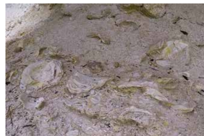
▲ Fossile østers.

etter kvart som vi padla. Grottene hadde allslags storleiker. Mange store grotter hadde store opningar og takhøgde på over ti meter. Dei følte nesten som katedralar. I desse var det alltid fuglereir oppunder taket. Og fuglane som hekka side om side var overraskande nok skarv og ringduer! I mindre grotter såg vi stimar av sølvaktig fisk som vart lyst opp av refleksjonane frå sollyset utanfor, eller i lyset frå hodelyktene. I andre grotter var veggane dekkja med gule, grøne og rosa algar.