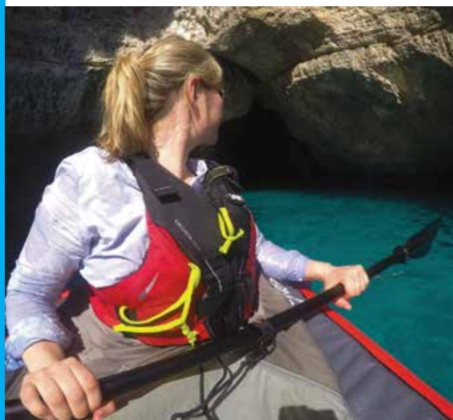
▲ Denne var ekkel.