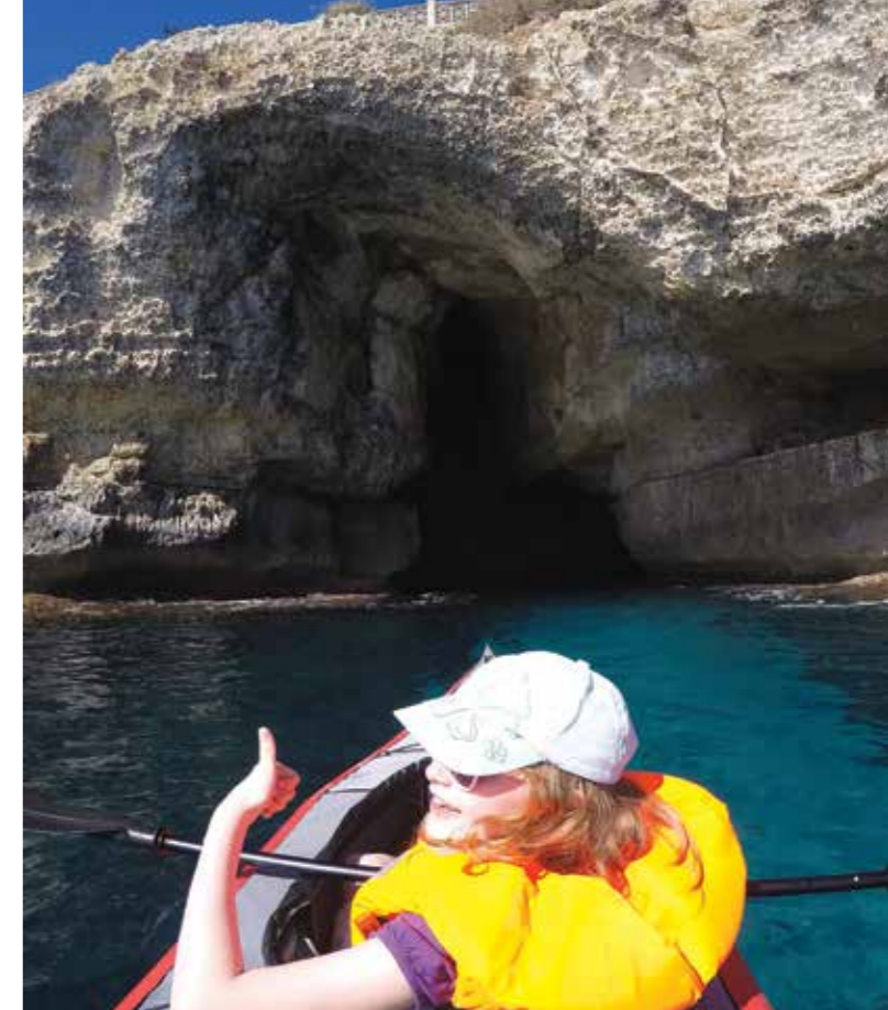
▲ Jenta har gitt klarsignal.

Nokre grotter har namn og er tatt med i guidebøker, men vi besøkte ikkje desse. Vår strategi var å padle ut frå ei strand og sjå kva vi kom til. Dei grottene vi padla i vart altså oppdaga