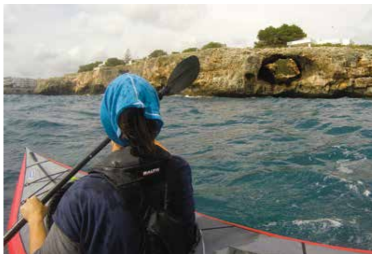
▲ Tørre grotter.