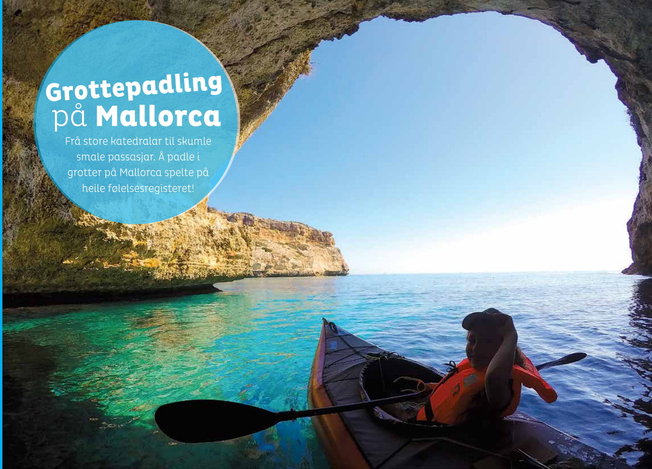
▲ Store grotter.

Frå store katedralar til skumle smale passasjar. Å padle i grotter på Mallorca spelte på heile følelsesregisteret!