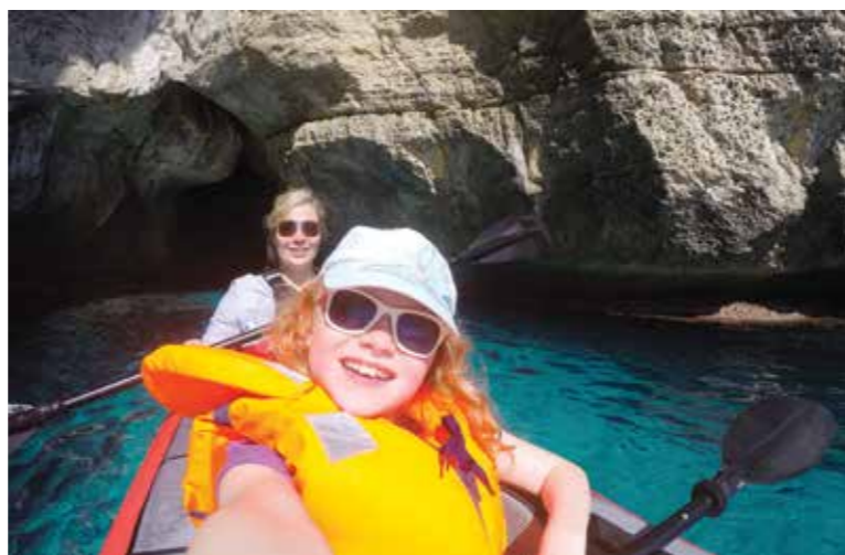
▲ Godt å kome ut i sola.