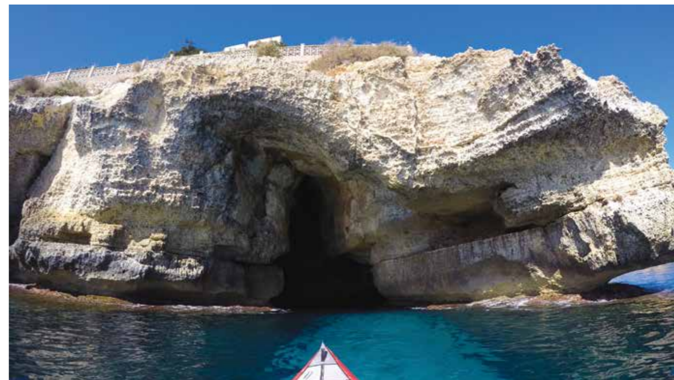
▲ Store grotter.