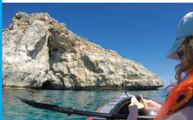
▲ Ny grotte i sikte.